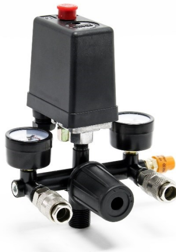
Illustration similaire, peut varier selon le modèle

Veillez lire et respecter le mode d'emploi et les consignes de sécurité avant la mise en service.