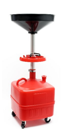
Immagine a scopo rappresentativo, può variare a seconda del modello

Prima di mettere in funzione il dispositivo, leggere e seguire le istruzioni per l'uso e le indicazioni di sicurezza.