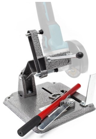
Immagine similare, può variare a seconda del modello

Prima della messa in funzione del dispositivo leggere e osservare le istruzioni per l'uso e le norme di sicurezza.