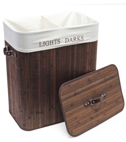
Immagine simile, può variare a seconda del modello

Prima della messa in funzione del dispositivo leggere e osservare le istruzioni per l'uso e le norme di sicurezza.