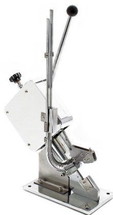
Imagen similar, puede diferir según el modelo

Por favor, lea y respete las instrucciones de uso e indicaciones de seguridad antes de la puesta en marcha.