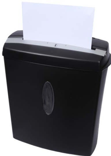
Immagine simile, può variare a seconda del modello

Prima della messa in funzione del dispositivo leggere e osservare le istruzioni per l'uso e le norme di sicurezza.