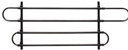
Immagine a scopo rappresentativo, può variare a seconda del modello

Prima di mettere in funzione il dispositivo, leggere e seguire le istruzioni per l'uso e le indicazioni di sicurezza.