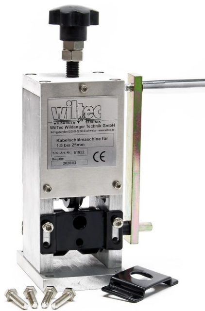
Immagine simile, può variare a seconda del modello

Prima della messa in funzione del dispositivo leggere e osservare le istruzioni per l'uso e le norme di sicurezza.