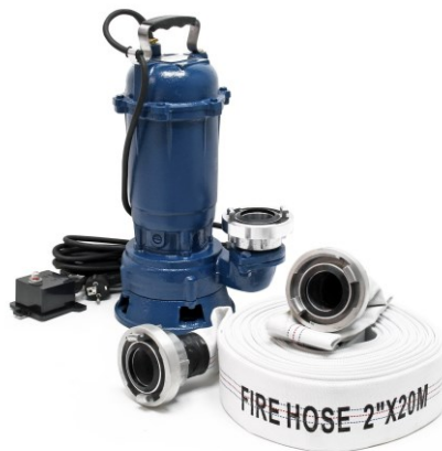
Illustration similaire, peut varier selon le modèle

Veillez lire et respecter le mode d'emploi et les consignes de sécurité avant la mise en service.