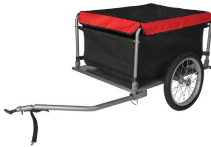
Immagine similare, può variare a seconda del modello

Prima della messa in funzione del dispositivo leggere e osservare le istruzioni per l'uso e le norme di sicurezza.