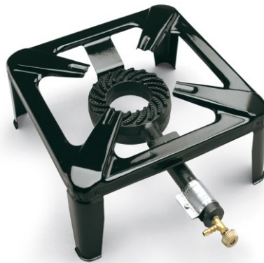
Immagine similare, può variare a seconda del modello

Prima della messa in funzione del dispositivo leggere e osservare le istruzioni per l'uso e le norme di sicurezza.