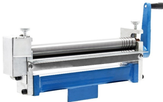
Immagine a scopo rappresentativo, può variare a seconda del modello

Prima di mettere in funzione il dispositivo, leggere e seguire le istruzioni per l'uso e le indicazioni di sicurezza.