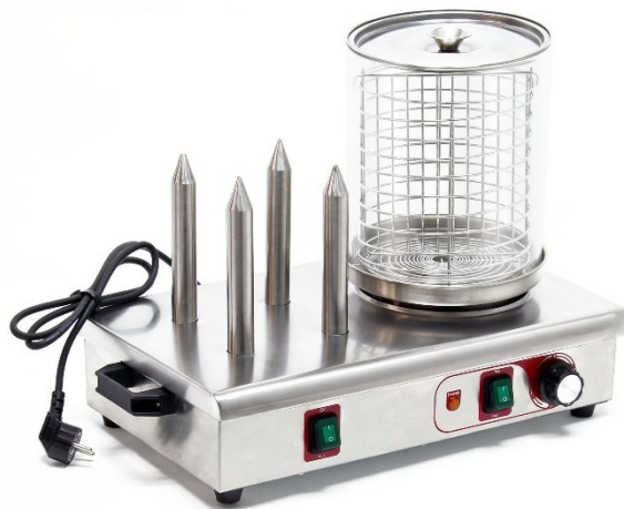
Immagine a scopo rappresentativo, può variare a seconda del modello

Prima di mettere in funzione il dispositivo, leggere e seguire le istruzioni per l'uso e le indicazioni di sicurezza!