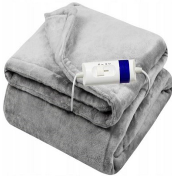
Immagine similare, può variare a seconda del modello

Prima di mettere in funzione il dispositivo, leggere e seguire le istruzioni per l'uso e le indicazioni di sicurezza.