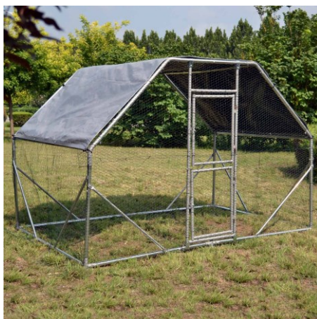
Imágenes similares, pueden variar según el modelo

Lea atentamente las instrucciones de funcionamiento e indicaciones de seguridad contenidas en este manual antes de usar por primera vez el dispositivo.