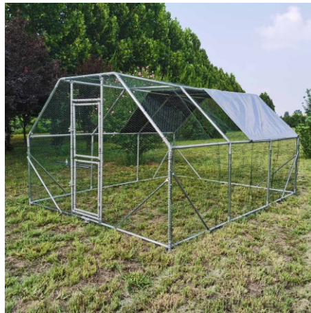
Immagine simile, può variare a seconda del modello

Prima della messa in funzione del dispositivo leggere e osservare le istruzioni per l'uso e le norme di sicurezza.