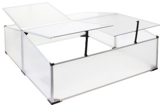
Immagine a scopo rappresentativo, può variare a seconda del modello

Prima di mettere in funzione il dispositivo, leggere e seguire le istruzioni per l'uso e le indicazioni di sicurezza.