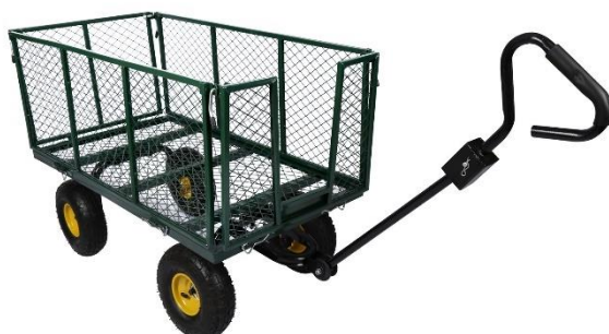
Illustration similaire, peut varier selon le modèle

Veillez lire et respecter le mode d'emploi et les consignes de sécurité avant la mise en service.