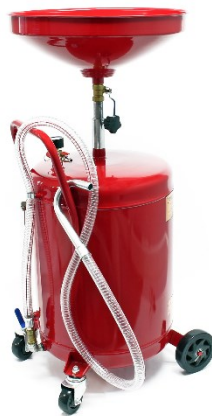
Immagine a scopo rappresentativo, può variare a seconda del modello

Prima di mettere in funzione il dispositivo, leggere e seguire le istruzioni per l'uso e le indicazioni di sicurezza.