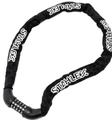
Illustration similaire, peut varier selon le modèle

Veuillez lire et respecter le mode d'emploi et les consignes de sécurité avant la mise en service.