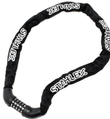
Immagine similare, può variare a seconda del modello

Prima della messa in funzione del dispositivo leggere e osservare le istruzioni per l'uso e le norme di sicurezza.