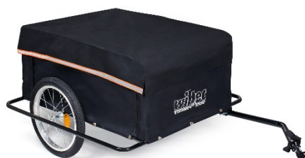
Imagen similar, puede diferir según el modelo

Por favor, lea y respete las instrucciones de uso e indicaciones de seguridad antes de la puesta en marcha.