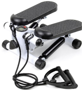
Immagine a scopo rappresentativo, può variare a seconda del modello

Prima di mettere in funzione il dispositivo, leggere e seguire le istruzioni per l'uso e le indicazioni di sicurezza.