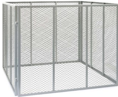
Immagine simile, può variare a seconda del modello

Prima della messa in funzione del dispositivo leggere e osservare le istruzioni per l'uso e le norme di sicurezza.