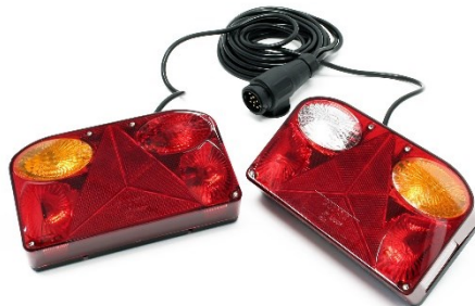
Imagen similar, puede diferir según el modelo

Lea y respete el manual de instrucciones y las indicaciones de seguridad antes de la puesta en marcha.