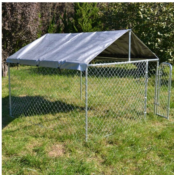
Imagen similar, puede diferir según el modelo

Por favor, lea y respete las instrucciones de uso e indicaciones de seguridad antes de la puesta en marcha.