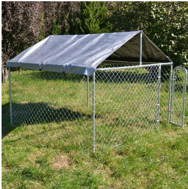
Immagine a scopo rappresentativo, può variare a seconda del modello

Prima di mettere in funzione il dispositivo, leggere e seguire le istruzioni per l'uso e le indicazioni di sicurezza.