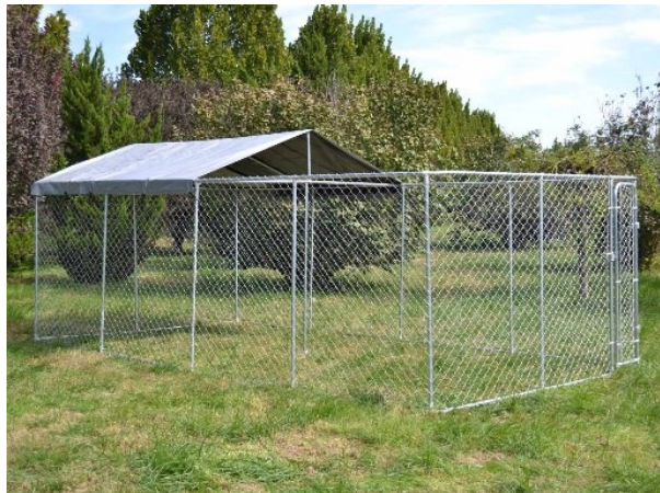
Immagine a scopo rappresentativo, può variare a seconda del modello

Prima di mettere in funzione il dispositivo, leggere e seguire le istruzioni per l'uso e le indicazioni di sicurezza.