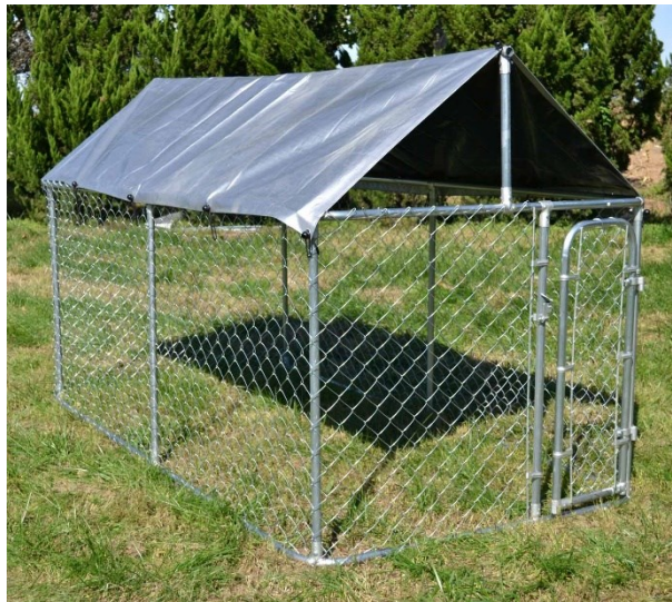
Immagine a scopo rappresentativo, può variare a seconda del modello

Prima di mettere in funzione il dispositivo, leggere e seguire le istruzioni per l'uso e le indicazioni di sicurezza.