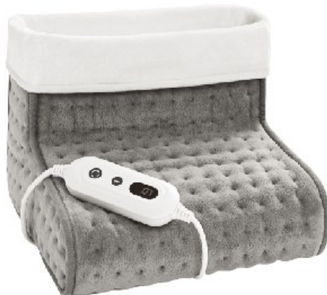
Immagine similare, può variare a seconda del modello

Prima della messa in funzione del dispositivo leggere e osservare le istruzioni per l'uso e le norme di sicurezza.