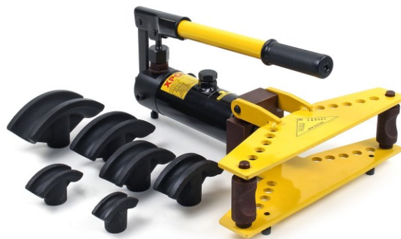
Illustration similaire, peut varier selon le modèle

Veuillez lire et respecter le mode d'emploi et les consignes de sécurité avant la mise en service.