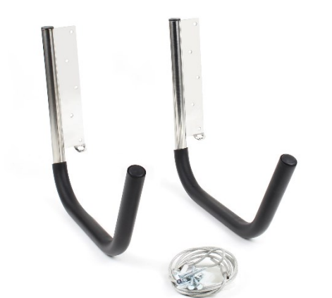
Imagen similar, puede diferir según el modelo

Por favor, lea y respete las instrucciones de uso e indicaciones de seguridad antes de la puesta en marcha.