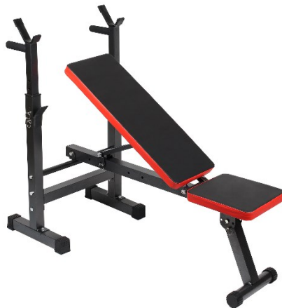
Imagen similar, puede diferir según el modelo

Por favor, lea y respete las instrucciones de uso e indicaciones de seguridad antes de la puesta en marcha.