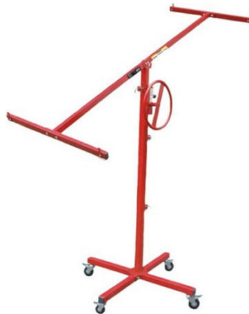
Immagine a scopo rappresentativo, può variare a seconda del modello

Prima di mettere in funzione il dispositivo, leggere e seguire le istruzioni per l'uso e le indicazioni di sicurezza.