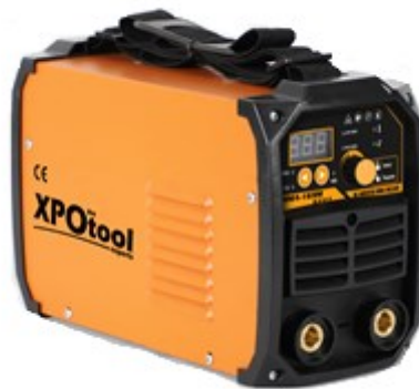
Illustration similaire, peut varier selon le modèle

Veillez lire et respecter le mode d'emploi et les consignes de sécurité avant la mise en service.