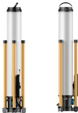
Imagen similar, puede diferir según el modelo

Lea y respete el manual de instrucciones y las indicaciones de seguridad antes de la puesta en marcha.