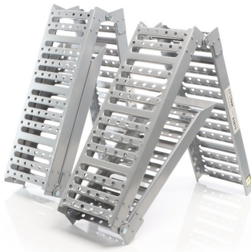
Imagen similar, puede diferir según el modelo

Lea y respete el manual de instrucciones y las indicaciones de seguridad antes de la puesta en marcha.