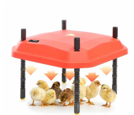
Imagen similar, puede diferir según el modelo

Por favor, lea y respete las instrucciones de uso e indicaciones de seguridad antes de la puesta en marcha.