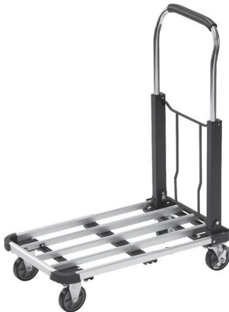
Imagen similar, puede diferir según el modelo

Por favor, lea y respete las instrucciones de uso e indicaciones de seguridad antes de la puesta en marcha.